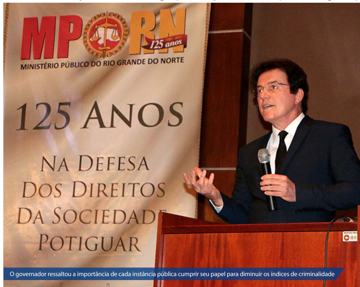
O governador ressaltou a importância de cada instância pública cumprir seu papel para diminuir os índices de criminalidade

O workshop contou com a presença de integrantes do Ministério Público do RN, representantes do judiciário e operadores da Segurança Pública.