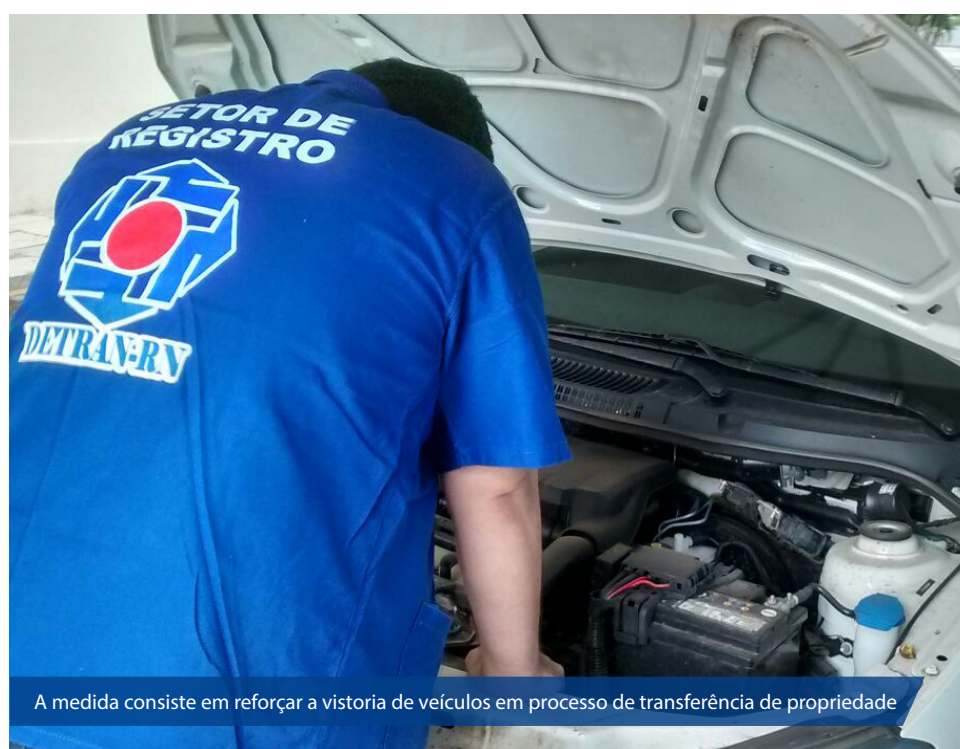
A medida consiste em reforçar a vistoria de veículos em processo de transferência de propriedade

A Direção Geral do Detran vem investido na qualificação de mais servidores para atuar no setor de Vistoria do Departamento. A Escola Pública de Trânsito do Detran formou neste ano 63 novos servidores no curso de Vistoriador Veicular, sendo deste total 28 policiais. Esses profissionais vão ser utilizados em serviços internos como também devem auxiliar os policiais em blitzes. Já que possuem conhecimento técnico para avaliar possíveis pontos de adulteração nos carros fiscalizados.