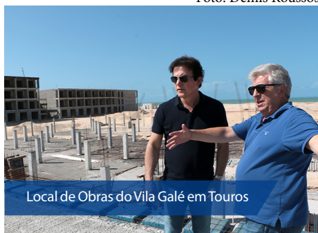
Local de Obras do Vila Galé em Touros

“Há seis meses lançamos a pedra fundamental deste empreendimento que hoje está em fase adiantada de construção. É importante lembrar que, com a agilidade e determinação do nosso governo, conseguimos liberar os trâmites burocráticos, dar segurança jurídica e infraestrutura para a instalação do Vila Galé em Touros que já es-