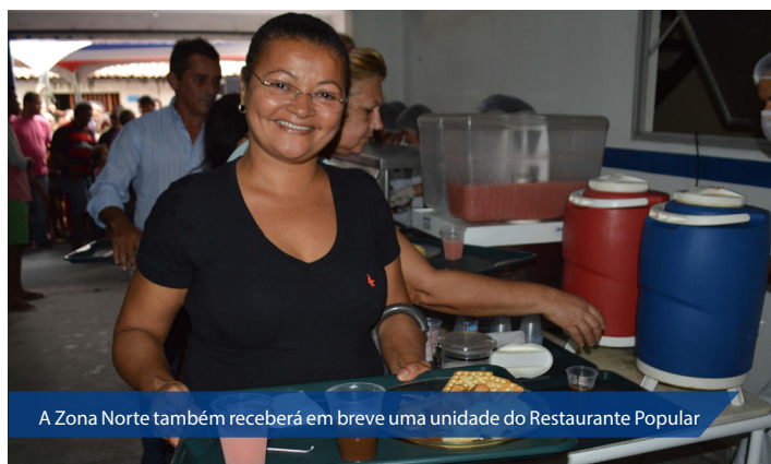
A Zona Norte também receberá em breve uma unidade do Restaurante Popular